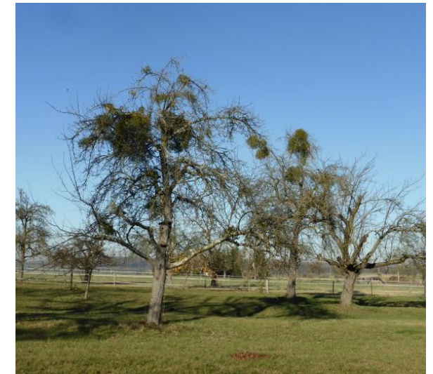
Viele Streuobstwiesen sind überaltert und daher anfälliger für Mistelbefall