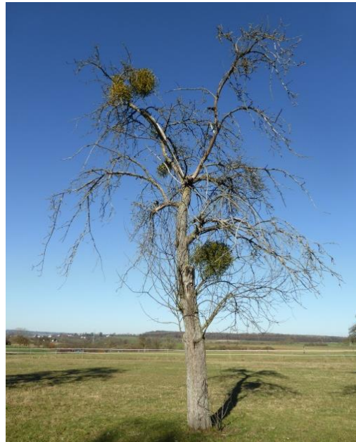
Das Ende: Absterbender Baum